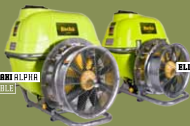
ELLITE MAXI ALPHA ACOPLÁVEL