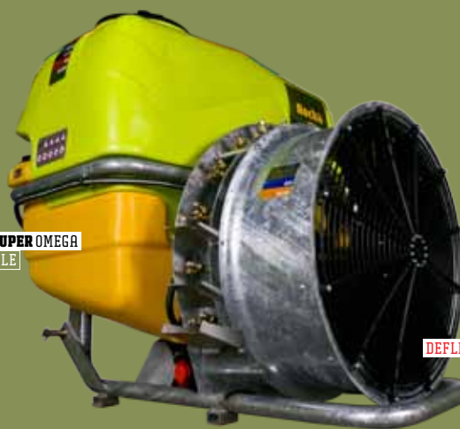
ELLITE SUPER OMEGA ACOPLÁVEL ACOPLÁVEL