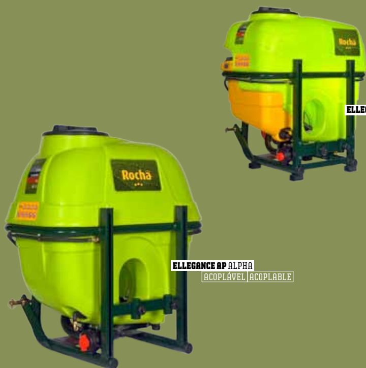
ELLEGANCE AP ALPHA ACOPLÁVEL | ACOPLABLE