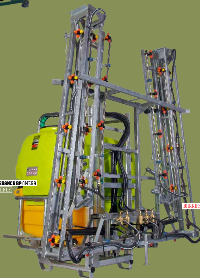
ELLEGANCE BP OMEGA ACOPLÁVEL | ACOPLABLE