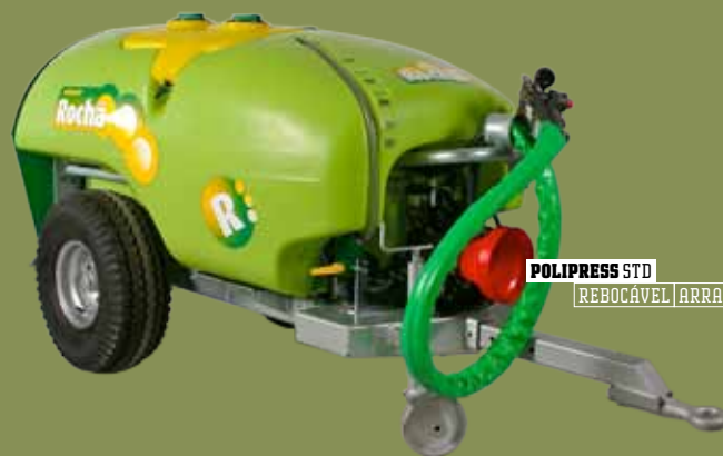
POLIPRESS STD REBOCÁVEL | ARRASTRADO