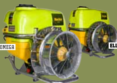
ELLITE STD OMEGA ACOPLÁVEL ACOPLÁVEL