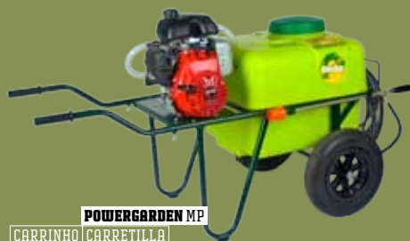
POWERGARDEN MP CARRINHO | CARRETILLA

PROFISSIONAL > JACTO PROJECTADO CHORRO P