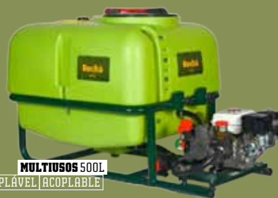
MULTIUSOS 500L ACOPLÁVEL | ACOPLABLE