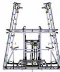
BARRA ABERTURA HIDRÁULICA BARRA APERTURA HIDRÁULICA