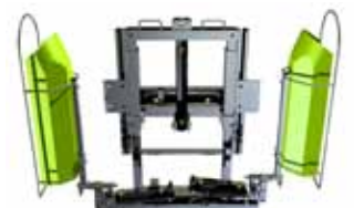
BARRA DESERVAGEM ENTRE-LINHAS BARRA HERBICIDA INTERFILAS

UNIÃO EUROPEIA EUROPEAN UNION Distribuição Regional