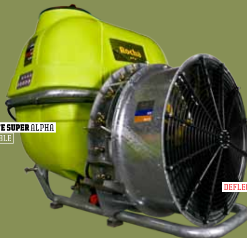
ELLITE SUPER ALPHA ACOPLÁVEL ACOPLÁVEL