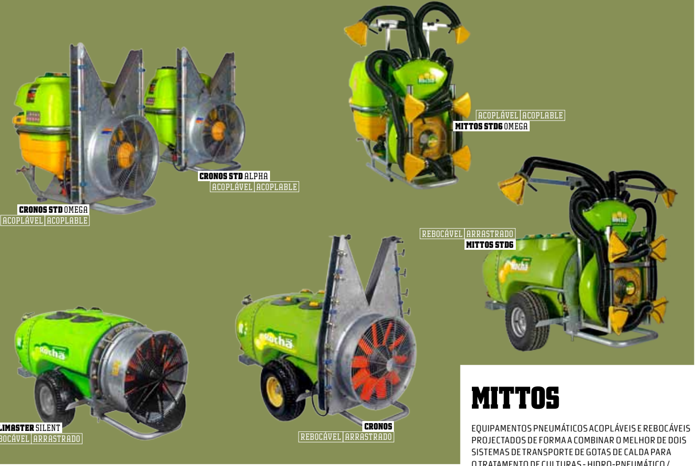
CRONOS STD OMEGA ACOPLÁVEL | ACOPLABLE

PROFISSIONAL > JACTO TRANSPORTADO CHORRO TRANSPORTADO